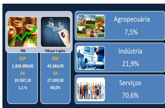
PIB / PIB per Capita / Valor Adicionado

A base da economia regional é a agropecuária. A região se caracteriza como centro de comercialização de bovinos e vem se reconfigurando com a expansão do cultivo de cana-de-açúcar. Outra característica, mais recente, da agropecuária regional tem sido a tendência à diversificação agrícola, com o surgimento de áreas de fruticultura e de cultivo de grãos.